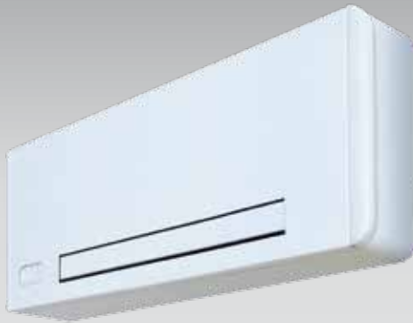
Solius Slim Inverter Mural