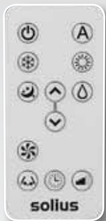
Comando remoto incluído