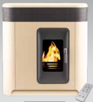
Solius Arrábida Marfim