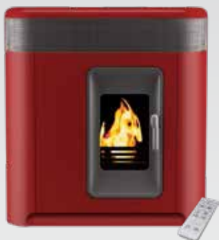
Solius Arrábida Bordeaux